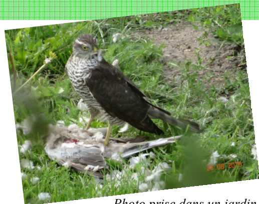
Photo prise dans un jardin de Cayeux, d'un épervier femelle en plein repas